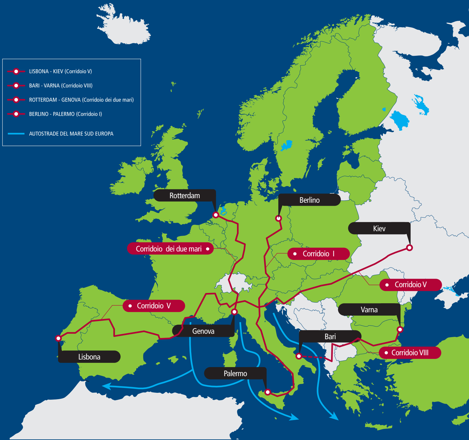
Fig. 2 - Corridoi transeuropei programmati sul territorio italiano

Processo approvato alla fine dello scorso anno alla delineazione di una strategia a lungo termine 2030-2050 attraverso un approccio per “corridoi” (termine con cui in Italia già si indicavano le Ten-T da almeno 15 anni) (fig. 2).