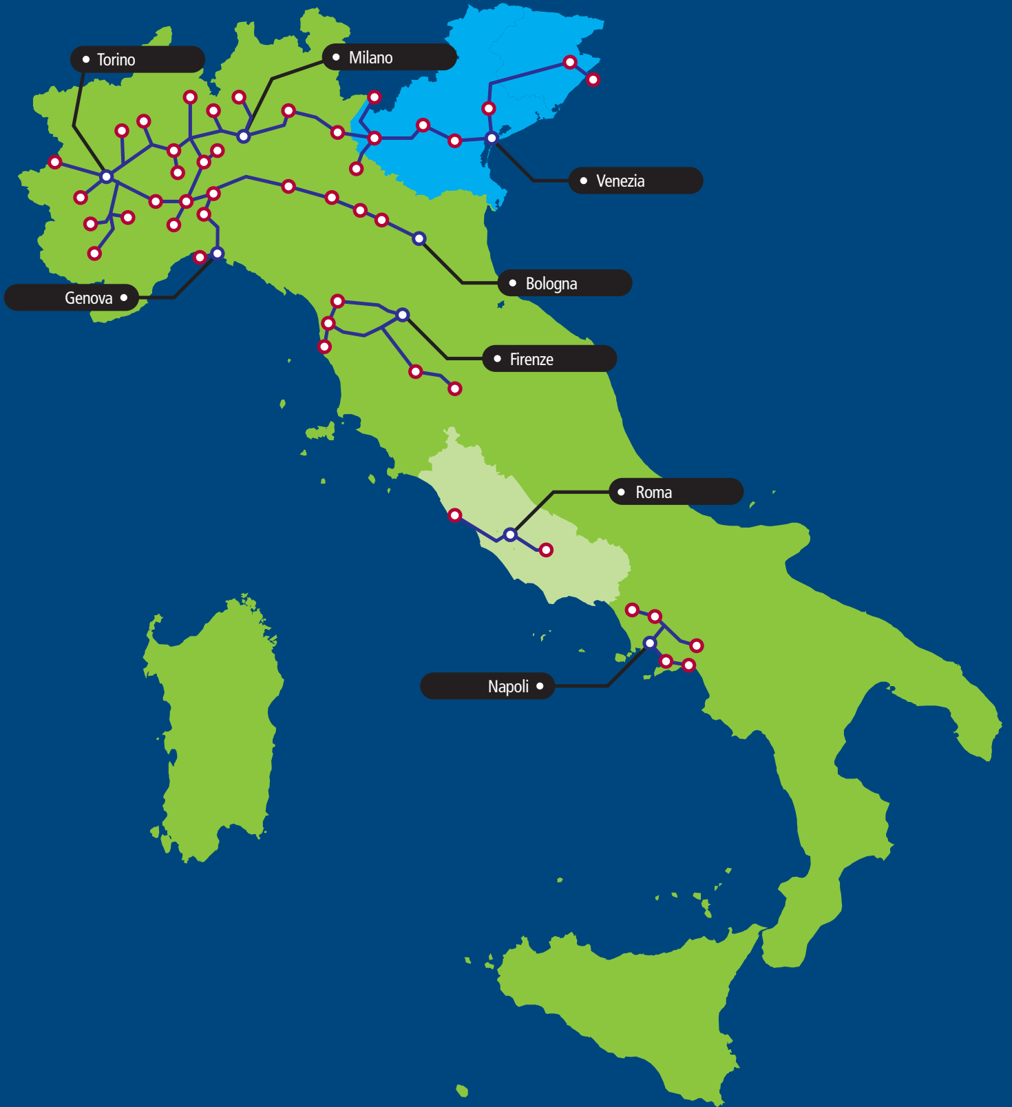
Fig. 3 - Situazione della rete ferroviaria italiana nel 1861