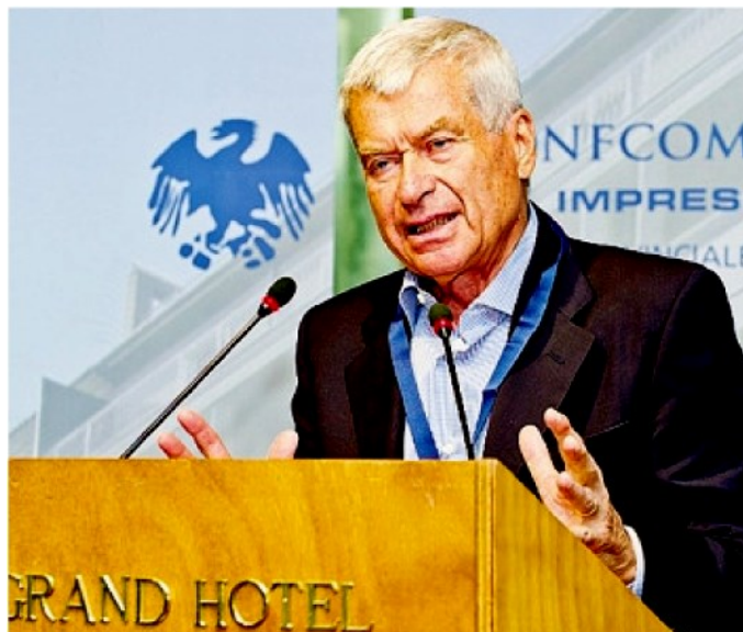
Carlo Sangalli , presidente nazionale di Confcommercio

Carlo Sangalli , presidente nazionale di Confcommercio , sul decreto «Necessari ampi correttivi in Parlamento e ampliare l'uso dei voucher»