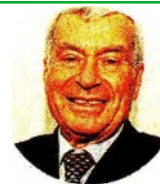
CARLO SANGALLI Presidente di Unioncamere

mos Italia, la nuova struttura camerale per l'internazionalizzazione, un programma per contattare migliaia di piccole aziende contribuendo a far crescere il nostro export. Possiamo essere il casello di entrata dell'autostrada dell'internazionalizzazione. E i "caselli di uscita" di questa speciale autostrada possono essere le Camere di commercio italiane all'estero, per individuare le opportunità di affari e per aiutare l'insediamento delle Pmi all'estero.