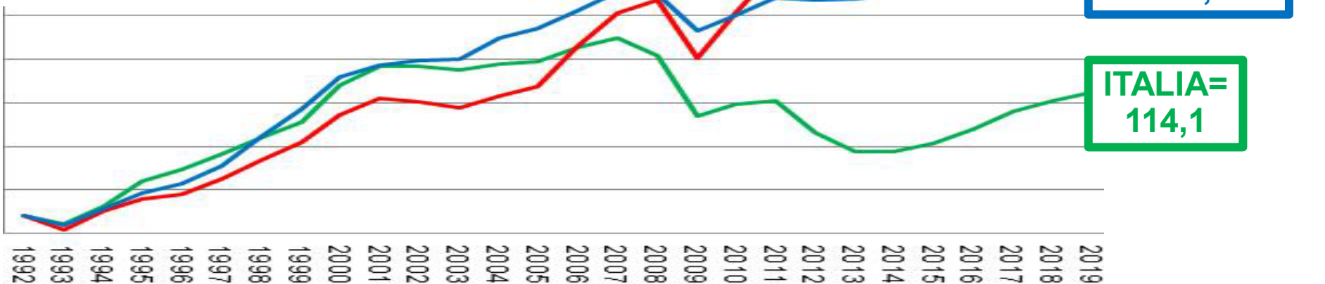
PIL pro capite reale indici 1992=100