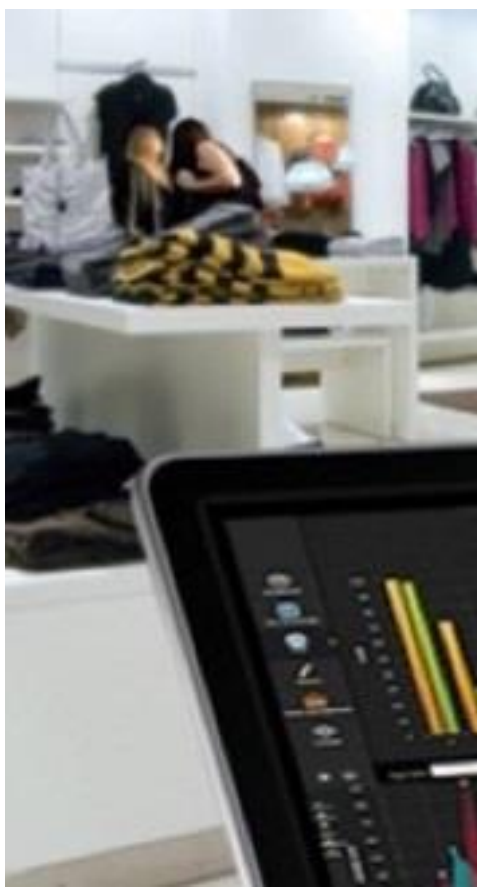
Nuovi stili di vita e di consumo